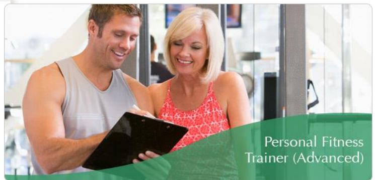
Personal Fitness Trainer (Advanced)

國際證書： 符合下列要求的學員將獲 國際康體專才培訓學院 IPTFA 頒發「銀級國際高級康體私人教練證書」：